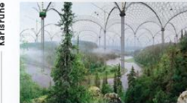
Ilkka Haloo, „Kika River“, 2014, © Ilkka Haloo

Inventing Nature. Pflanzen in der Kunst Staatliche Kunsthalle Karlsruhe 27. März – 27. Juni