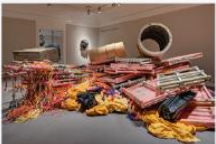
Phyllida Barlow, „untitled: hoard 2017“, © Phyllida Barlow. Courtesy the artist and Hauser & Wirth. Foto: Lila Photo

Phyllida Barlows Skulpturen testen spielerisch die Grenzen von Masse, Höhe und Raumvolumen. Sie sind eine Herausforderung für das Publikum, das seine Beziehung zum skulpturalen Objekt, zum Ausstellungsraum und zur umliegenden Welt stets neu definieren muss. Als Material wählt Barlow meist Überreste und Wertstoffmüll, jede Skulptur birgt das Potenzial, in einer künftigen Arbeit recycelt zu werden. Mit einer umfassenden Ausstellung wird das in fünf Jahrzehnten entstandene Werk der britischen Künstlerin gewürdigt.