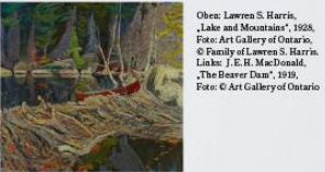
Oben: Lawren S. Harris, „Lake and Mountains“, 1928, Foto: Art Gallery of Ontario, © Family of Lawren S. Harris. Links: J. E. H. MacDonald, „The Beaver Dam“, 1919, Foto: © Art Gallery of Ontario