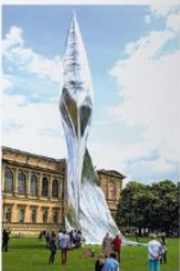
„Der Flug des Phönix“ vor der Altes Pinakothek beim Kunstareal. Fest 2015, Künstlergruppe Super

Den Künstler*innen aus dem Kreis des Blauen Reiter galt Kunst als universelle Sprache. Ihr Credo lautete: „Das ganze Werk, Kunst genannt, kennt keine Grenzen und Völker, sondern die Menschheit.“ In zwei ineinandergreifenden Ausstellungen zeigt das Lenbachhaus den Blauen Reiter im Dialog mit künstlerischen Kollektiven der Moderne, u. a. aus Buenos Aires, Delhi, Tokio, Lahore, Casablanca, São Paulo, Khartum und Peking. Der Zeitraum von etwa 1900 bis 1970 schließt den Beginn verschiedener weltweiter Modernisierungsbewegungen ein und beleuchtet deren Entwicklung.