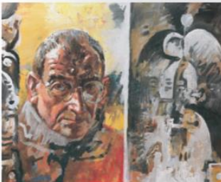
Oben: Willi Sitte, Gedanken eines ehemaligen Formalisten, 1993, Privatsammlung, daneben „Bergung aus Hochwasser“ von 1958, Kulturstiftung Sachsen-Anhalt, Kunstmuseum Moritzburg Halle (Saale). Unten: Leuna 1969, 1967-69, Nationalgalerie, Staatliche Museen Berlin (Ausschnitt)

▷ Sittes Welt, Willi Sitte: Die Retrospektive Kunstmuseum Moritzburg Halle (Saale) 17. Oktober 2021 – 9. Januar 2022