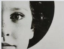
Max Burchartz, „Lotten Augs“, 1928, © Münchener Stadtmuseum, Sammlung Fotografie/ VG Bild-Kunst, Bonn 2020

Eine Zeit der Extreme und Gegensätze: Wie die Malerei befand sich auch die Fotografie Anfang der Zwanzigerjahre im tiefgreifenden Umbruch. Die modernen Stilrichtungen der Neuen Sachlichkeit in der Malerei und des Neuen Sehens in der Fotografie strebten eine sachliche und realistisch-veristische Wiedergabe des Bildgegenstands an. Die Ausstellung spürt diesem künstlerischen Dialog zwischen Malerei und Fotografie nach. Präsentiert werden Werke von Künstler*innen, die in Deutschland zwischen 1920 und 1935 gewirkt haben, u. a. von Otto Dix, Hannah Höch und August Sander.