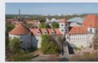
Kunstmuseum Moritzburg Halle (Saale) Die Moritzburg, Ende des 15. Jahrhunderts als erbischöfliche Residenz errichtet, beherbergt das Kunstmuseum des Landes Sachsen-Anhalt. Auf mehr als 3000 qm präsentiert es mit mehr als 600 Objekten seine Sammlung bildender und angewandter Kunst vom Mittelalter bis in die Gegenwart. Herzstück ist die Präsentation „Wege der Moderne. Kunst in Deutschland im 20. Jahrhundert“, die Kunst-, Museums- und Sammlungsgeschichte thematisiert und dabei auch offensiv mit der Kunst im „Dritten Reich“ und in der DDR umgeht

nach der Wende zu seiner Überzeugung, weshalb ihn der Osten wie der Westen des wiedervereinten Deutschlands wie ein heißes Eisen behandeln. Im Kunstbetrieb der vergangenen 30 Jahre spielte er kaum eine Rolle; sein Schaffen harrt bis heute einer Aufarbeitung. Anlässlich seines 100. Geburtstags will das Kunstmuseum Moritzburg Halle (Saale) dies mit einer großen Retrospektive ändern. Mit mehr als 200 Arbeiten von 1938 bis etwa 2005 kann man sich erstmals umfassend mit Willis Sittes künstlerischem Schaffen auseinandersetzen. Seine Rolle im System der Kunst der DDR soll dabei ebenso erfahrbar werden wie vor allem seine individuelle künstlerische Entwicklung. Zahlreiche Entdeckungen sind garantiert. Halle (Saale) ist der ideale Ort für eine solche Ausstellung, denn hier fand 1981, zu seinem 60. Geburtstag, auch die bislang letzte große Site-Werkschau statt.