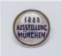
Broche, unbekannt, München, 1888, Weißmetall, gestanz, emailiert, Sammlung Dr.-v. Zeschwitz

MUC / Schmuck Münchener Stadtmuseum Bis 5. April