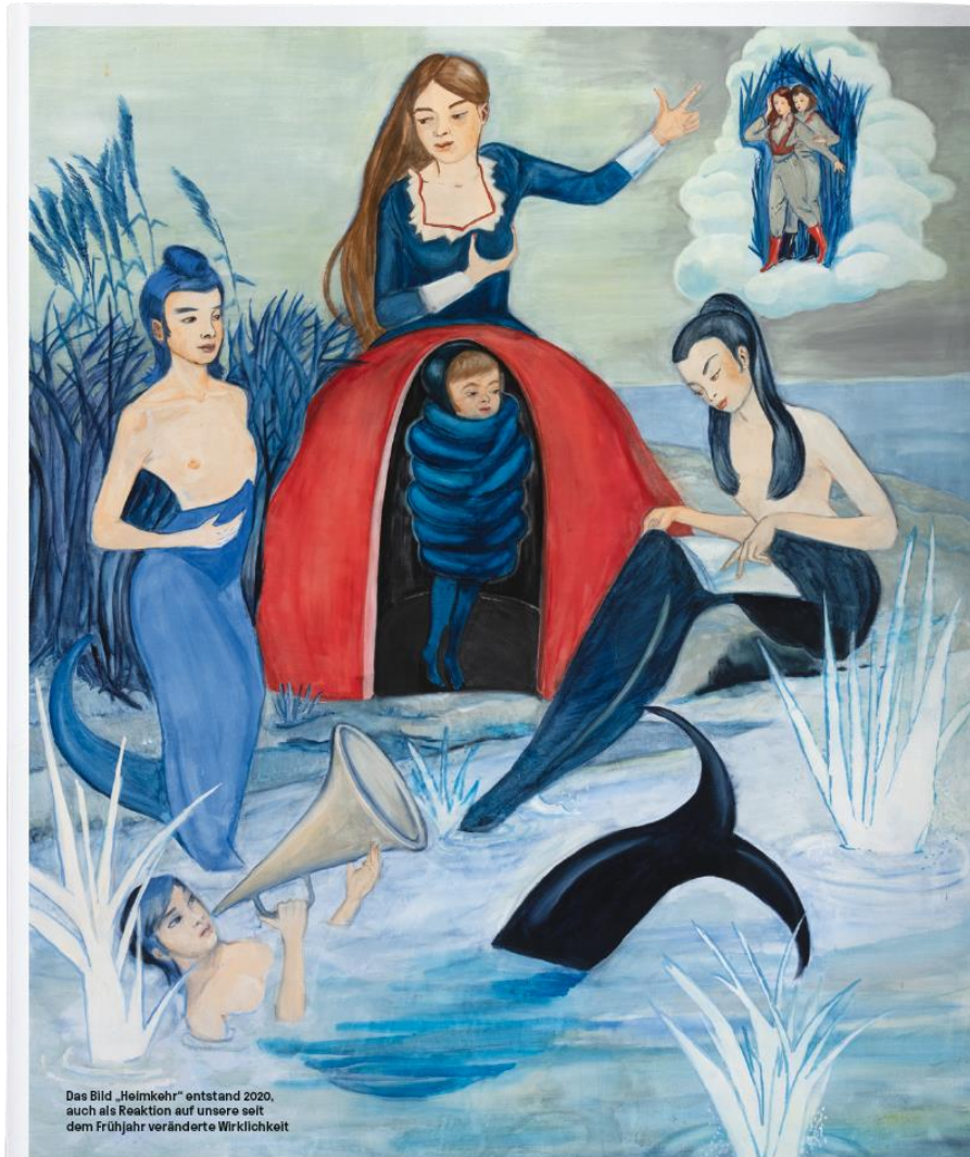
Das Bild „Heimkehr“ entstand 2020, auch als Reaktion auf unsere seit dem Frühjahr veränderte Wirklichkeit

Bilder: Alle Rechte Rosa Loy/Galerie Künster & Lippert / Kohn Gallery, Los Angeles / Gallery Kohn Seoul, Korea / New Museum / V&A New York, New York 2020